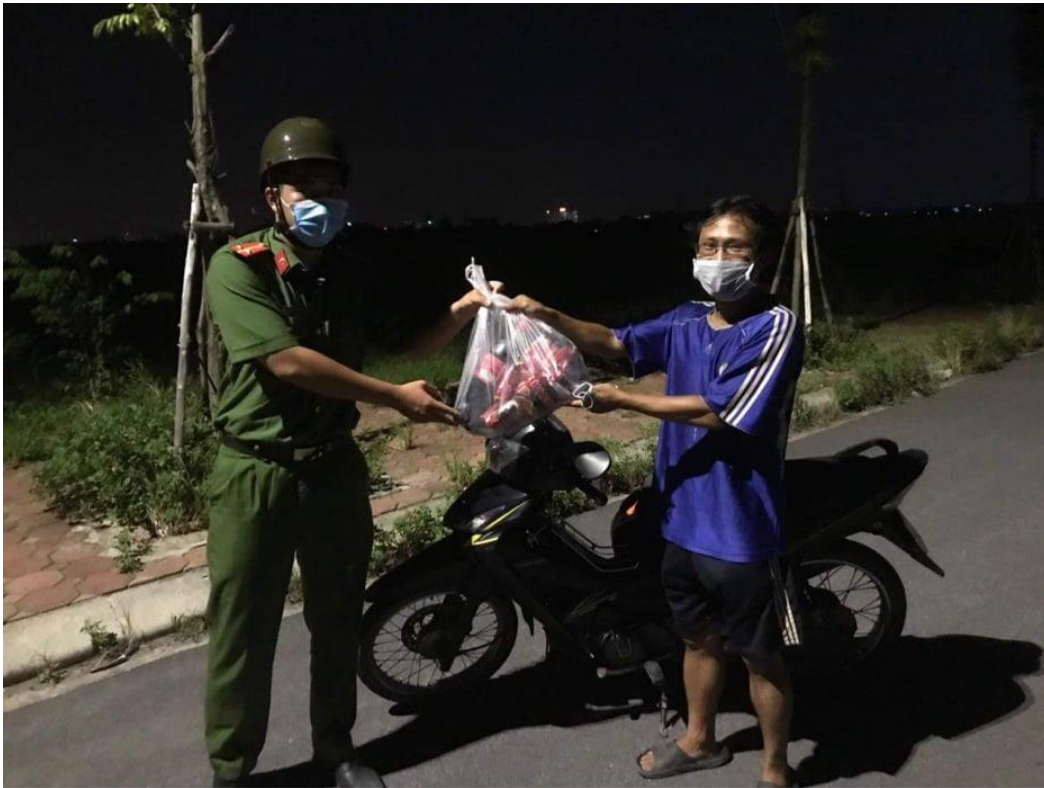
Công an xã Đại Áng không quản ngày đêm, trao quà cho người dân vùng dịch

Không những làm các nhiệm vụ như trực chốt, tuần tra, kiểm soát theo sự chỉ đạo của trưởng ban phòng chống dịch bệnh quốc gia mà bên cạnh đó về hoạt động riêng của tập thể cơ quan, bố và đồng đội còn quan tâm và động viên đến những gia đình có hoàn cảnh khó khăn do bị ảnh hưởng bởi dịch bệnh bằng những phần quà ý nghĩa.