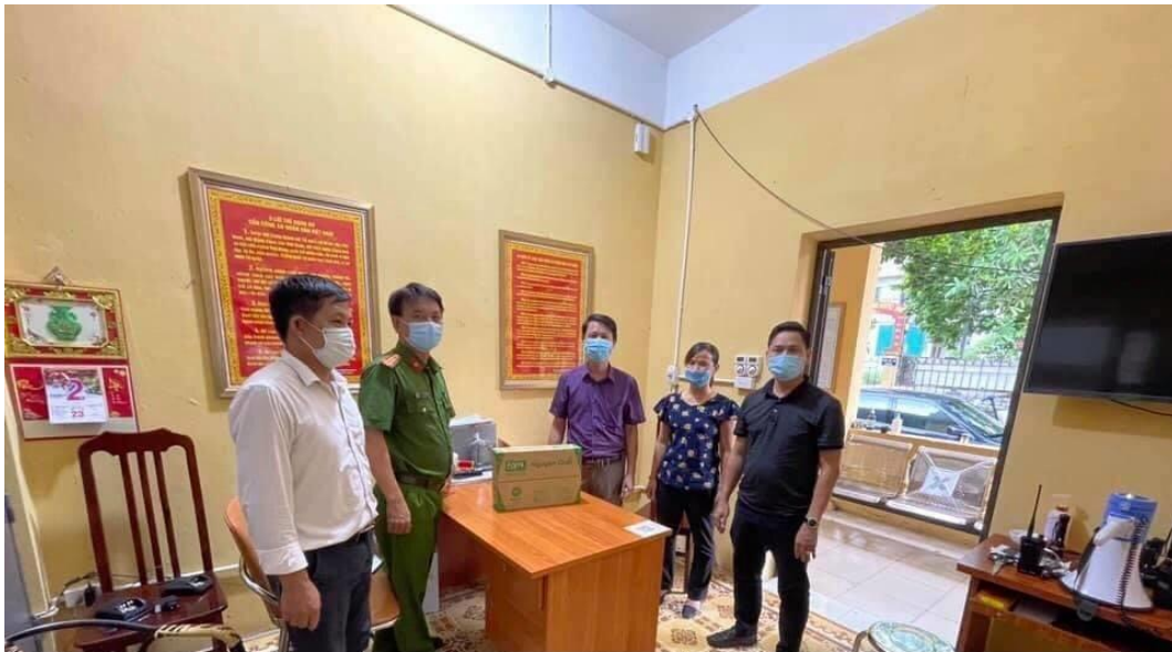
Bố em và Chính quyền phối hợp trong công tác phòng dịch

đầu chống dịch luôn thắt chặt các chốt kiểm tra, rà soát về các trường hợp vi phạm trong phòng chống dịch bệnh 24/7.