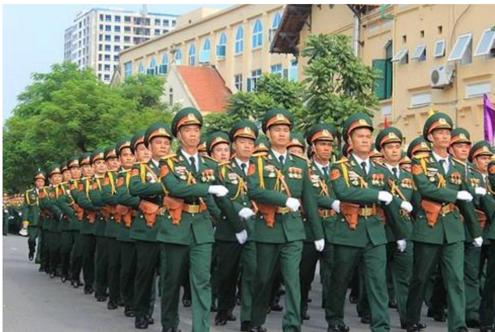
Lực lượng vũ trang diễu hành dịp 2-9

- Trong giai đoạn hiện nay, LLVT thủ đô Hà Nội đã quán triệt và tổ chức thực hiện tốt đường lối quốc phòng toàn dân, quan điểm xây dựng LLVT nhân dân của Đảng, Nghị quyết Trung ương 8 (Khóa XI) "Về chiến lược bảo vệ Tổ quốc trong tình hình mới". Chủ động tham mưu với cấp ủy, chính quyền thành phố lãnh đạo, chỉ đạo thực hiện có hiệu quả nhiệm vụ quân sự, quốc phòng (QS, QP); xây dựng TP Hà Nội thành khu vực phòng thủ (KVPT) vững chắc trong tình hình mới.