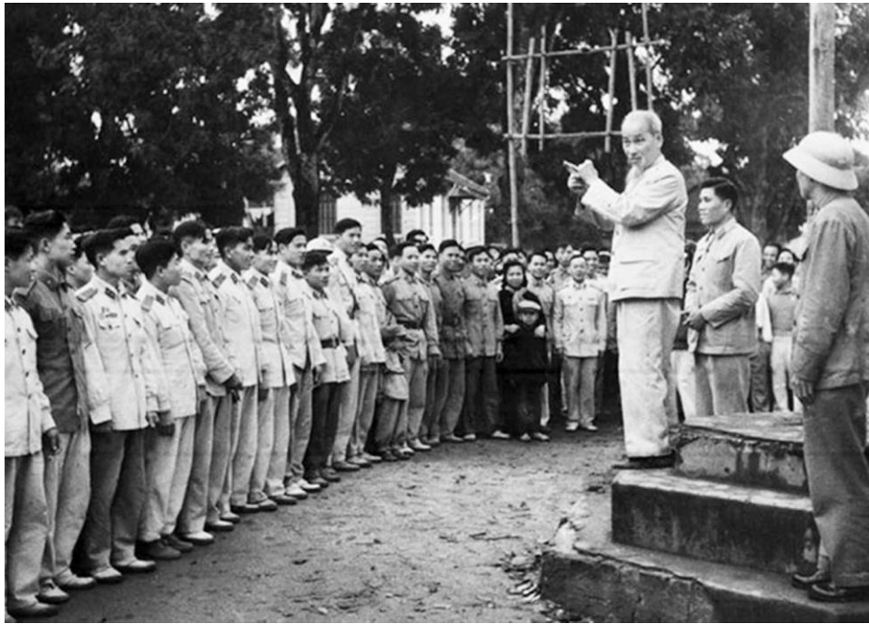
Chủ tịch Hồ Chí Minh thăm đơn vị Công an nhân dân vũ trang bảo vệ Thủ đô Hà Nội, ngày 14-2-1961.

- Trong giai đoạn hiện nay, LLVT thủ đô Hà Nội đã quán triệt và tổ chức thực hiện tốt đường lối quốc phòng toàn dân, quan điểm xây dựng LLVT nhân dân của Đảng, Nghị quyết Trung ương 8 (Khóa XI) "Về chiến lược bảo vệ Tổ quốc trong tình hình mới". Chủ động tham mưu với cấp ủy, chính quyền thành phố lãnh đạo, chỉ đạo thực hiện có hiệu quả nhiệm vụ quân sự, quốc phòng (QS, QP); xây dựng TP Hà Nội thành khu vực phòng thủ (KVPT) vững chắc trong tình hình mới.