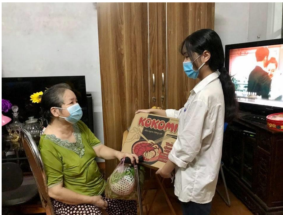
Tặng nhu yếu phẩm, giúp đỡ hoàn cảnh khó khăn.

do bị ảnh hưởng bởi dịch bệnh. Tuy chỉ là một chút quà nhưng trong thời đoạn này thì một miếng khi đói sẽ bằng nhiều gói khi no, của ít lòng nhiều.