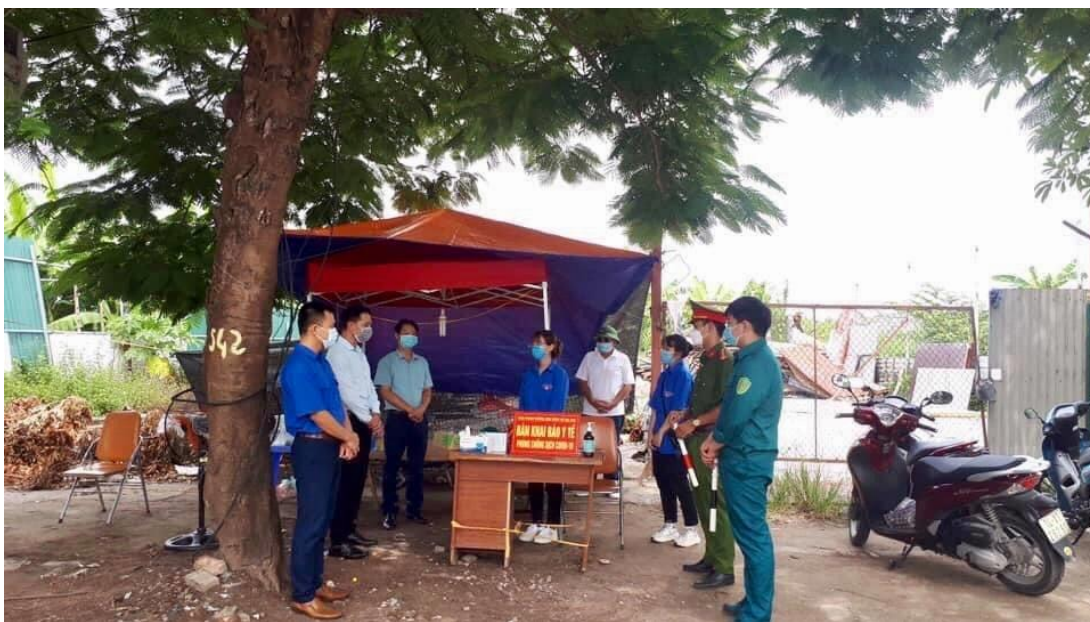
Một chốt phòng dịch của Công an xã Đại Áng

Bố em và các chiến sĩ công an cùng đơn vị không quản ngại ngày đêm, nắng mưa quyết tâm bám trụ, túc trực 24/24 giờ tại các chốt kiểm soát dịch bệnh, đảm bảo an toàn tại các khu vực phong tỏa... Nhiều hôm, bố đi làm liên tục nhiều ngày bởi tính chất công việc vừa bận rộn, vừa nguy hiểm của bố và các chiến sĩ nên bố bảo phải chấp nhận có thể hy sinh, có thể bị lây nhiễm dịch bệnh trong quá trình thực thi nhiệm vụ. Với tinh thần "chống dịch như chống giặc", để đảm bảo cho công tác chống dịch trở nên hiệu quả hơn, các chiến sĩ công an đơn vị bố còn phối hợp cùng với bên y tế để truy vết các đối tượng có liên quan đến người bệnh để có thể kiểm soát và cách ly kịp thời, đảm bảo sức khỏe và an toàn cho người dân trên địa bàn xã.