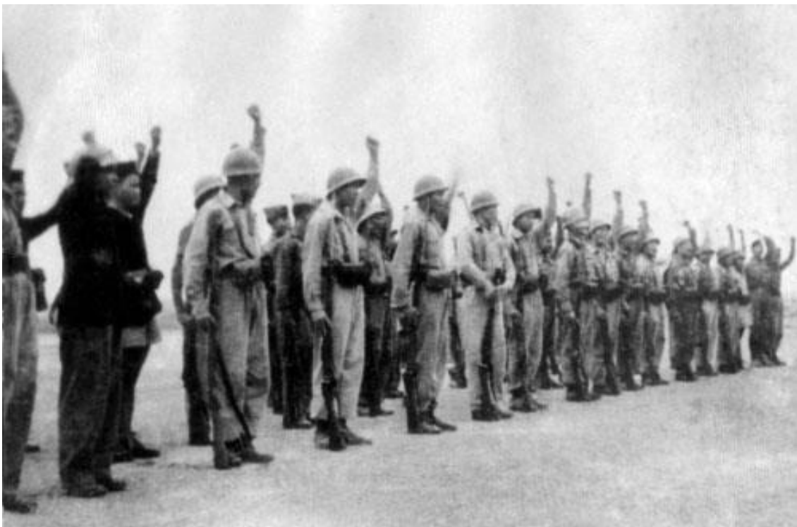
Quyết tử quân thì kiên quyết sống chết giữ vững Thủ đô, 12-1946

Từ sau Cách mạng tháng Tám, LLVT Thủ đô Hà Nội cùng các tầng lớp nhân dân mưu trí, ngoan cường, kiên quyết đấu tranh đập tan mọi âm mưu, thủ đoạn và hoạt động chống phá của tập đoàn đế quốc và các thế lực thù địch, phản cách mạng trong và ngoài nước, bảo vệ vững chắc thành quả cách mạng, đưa cách mạng Việt Nam thoát khỏi tình thế "Ngàn cân treo sợi tóc", vững bước đi vào cuộc kháng chiến trường kỳ, gian khổ, oanh liệt và vẻ vang.