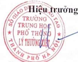
Dương Hai Bảy Mười