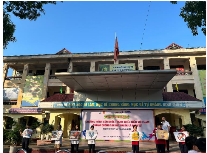
Đội tuyên truyền và những hình ảnh minh họa

Với những kiến thức sâu, rộng của mình, đội tuyên truyền đã mang đến một sức nóng cho sân khấu. Những “thỏi son”, những “usb”, những gì ngớ... đã được các thành viên chỉ rõ và giúp học sinh có được những nhận thức đúng về thuốc lá điện tử và tác hại không lường hết của nó. Chất Nicotin - là chất độc nặng có trong thành phần thuốc trừ sâu, khi sử dụng sẽ ảnh hưởng nhiều đến sức khỏe, thần kinh và gây nghiện của thuốc lá điện tử. Khi sử dụng bạn sẽ bị “khóa chân” bởi chúng, lệ thuộc với chúng và chết vì chúng.